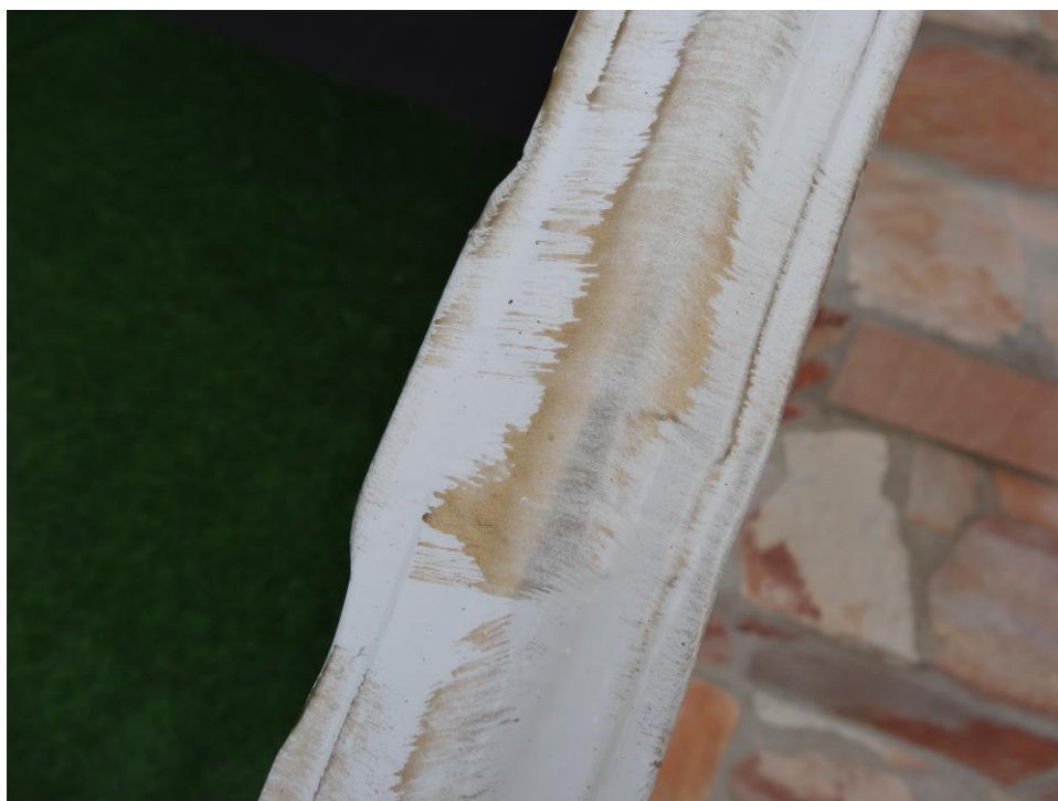
Die künstliche Alterung erfolgte unfachmännisch.