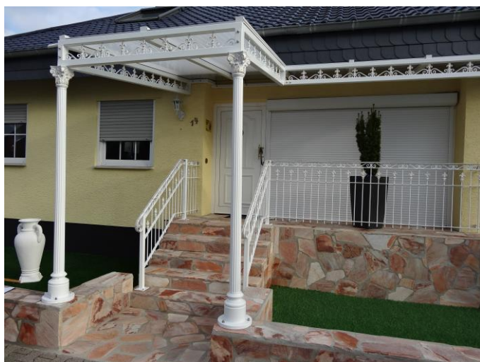
Die beanstandete Gesamteingangslösung.