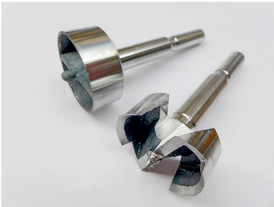
Das Werkstück (Forstner-Bohrer) vor und nach der Schlitzbearbeitung mit dem Gold-Slot-Scheibenfräser.