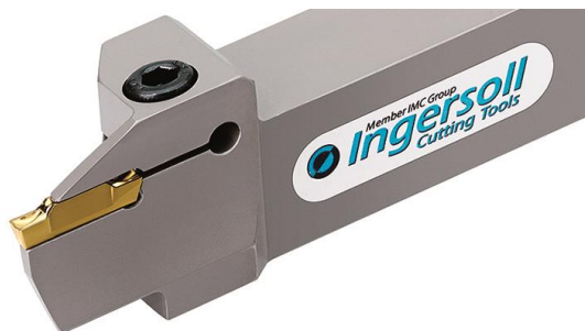
Der Ingersoll T-Clamp-Ultra-Plus-Schneidenträger mit zweischneidiger Stechplatte zum Abstechen der Werkzeugrohlinge.