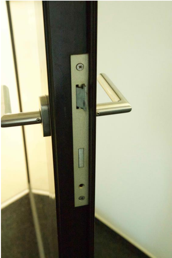
Der Drücker ist falsch.