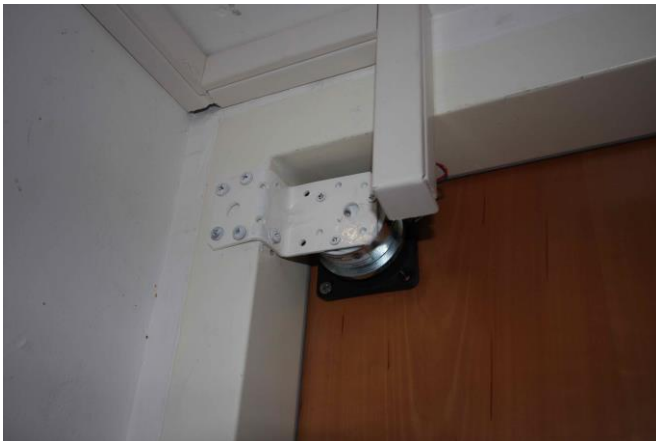
Die elektrische Verriegelung mit Haftmagnet.