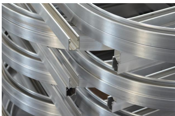
Das Biegen sollte man Spezialisten überlassen.