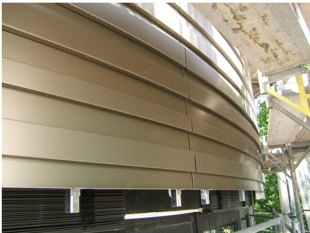
Beim Biegen ist höchste Präzision gefragt.