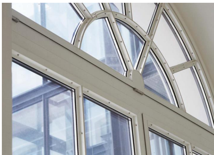
Mit gebogenen Profilen können vielfältige Fensterformen umgesetzt werden. Hier die Nürnberger Akademie.