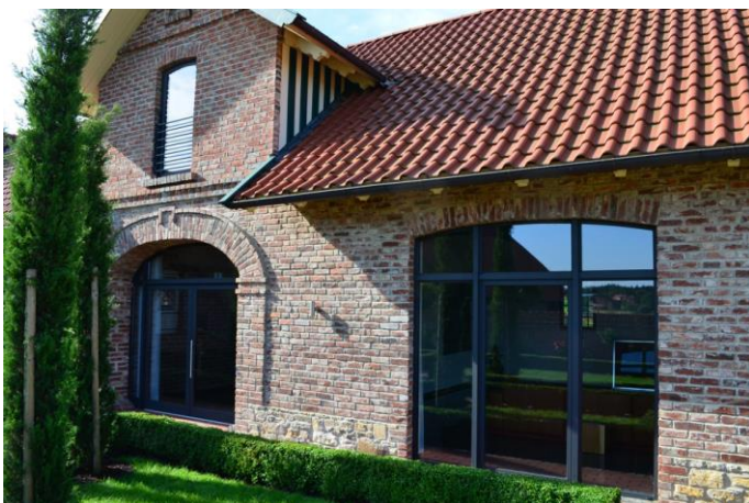
Auch in der Sanierung sind gebogenen Lösungen oft gefragt.