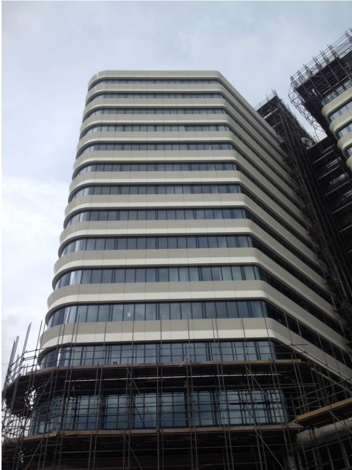
Beispiel für Biegelösungen: Arena Towers in Amsterdam