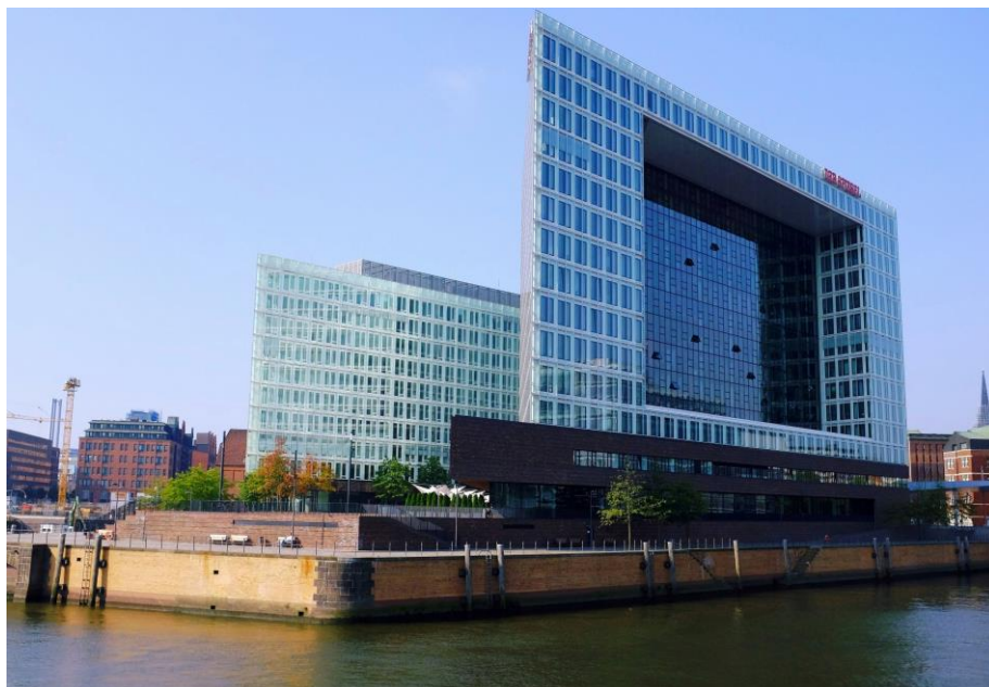
Für das Spiegel-Gebäude in Hamburg lieferte Trelleborg Sealing Profiles unter anderem Zwei-Komponentendichtungen für die Pfosten-Riegel-Konstruktion.