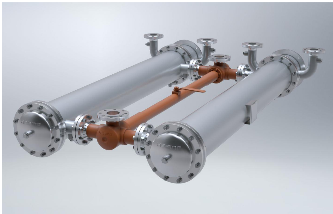
Ein Wärmetauscher der Firma Hering mit diversen Rohr-Flansch-Verbindungen.