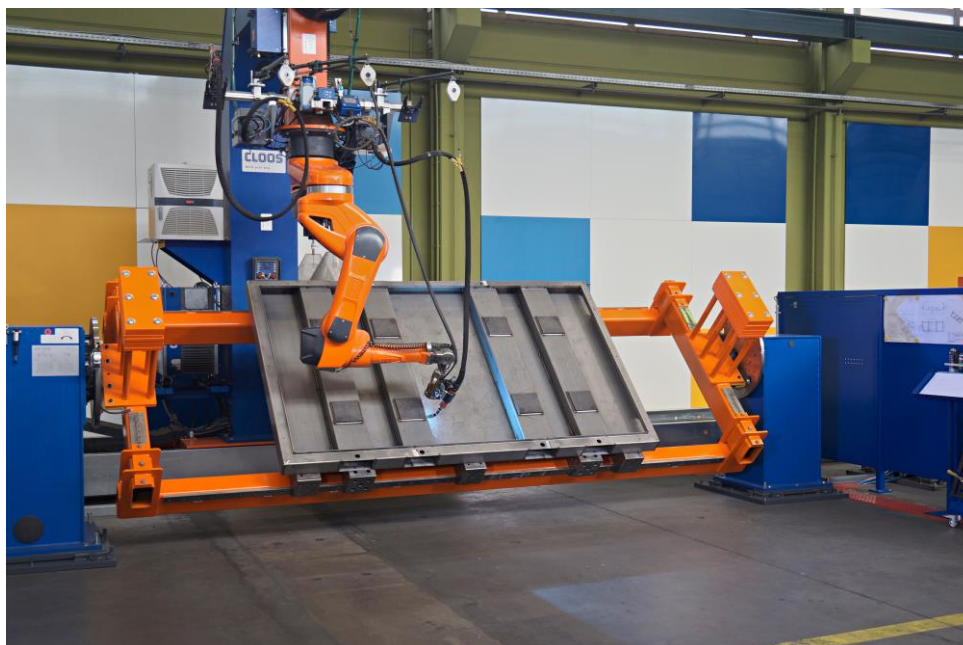
Robotersteuerung, die Steuerung des Schweißprozesses und die Steuerung der Drehvorrichtung müssen genau aufeinander abgestimmt sein.