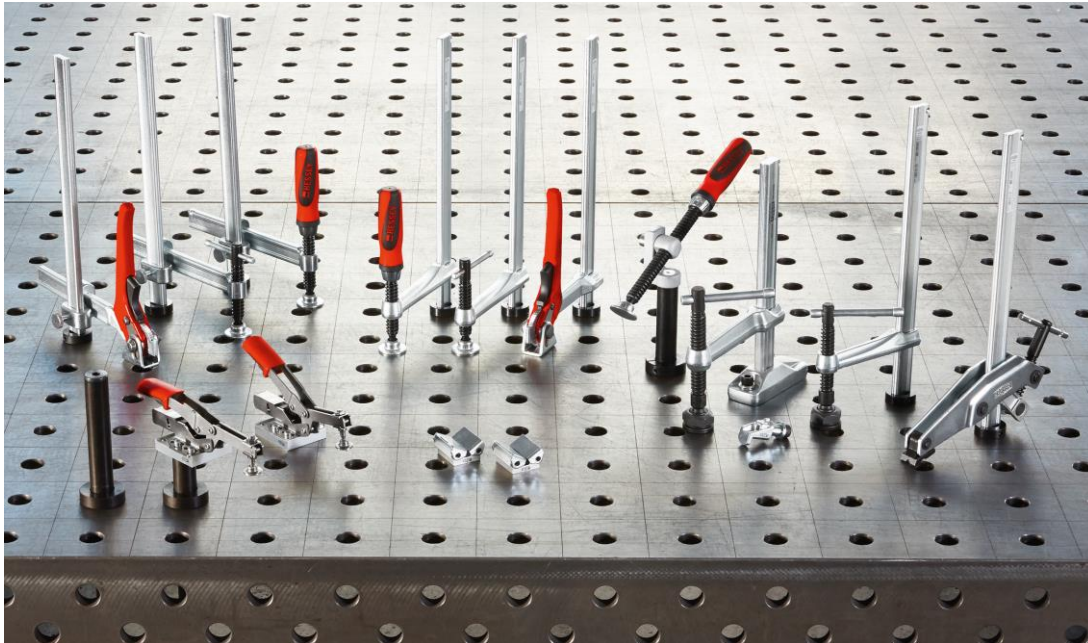
Eine einfache aber hilfreiche Form der Mechanisierung: Sortiment von Spannsystemen auf einem Schweißstisch.