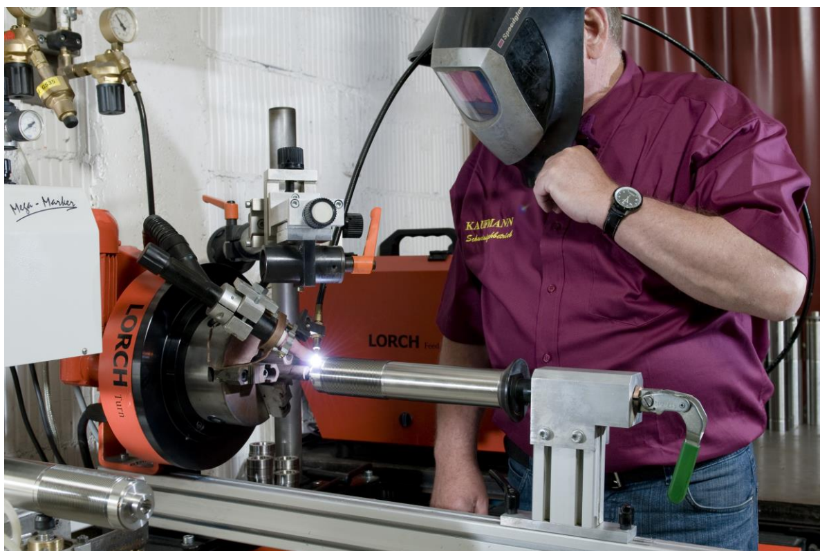
Mit einem Baukastensystem kann sich der Anwender seine Lösung individuell zusammenstellen.