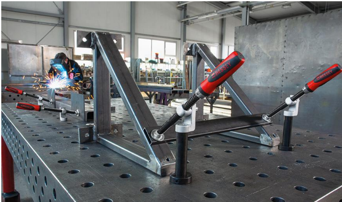
Beispiel für den Einsatz eines Spannsystems.