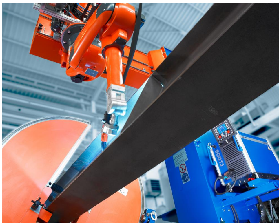
Hier werden schwere Stahlprofile vollautomatisch geschweißt.