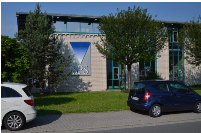
Bei SPS in Dohna entstehen Teile aus Edelstahl mit höchster Präzision und feinsten Oberflächen.