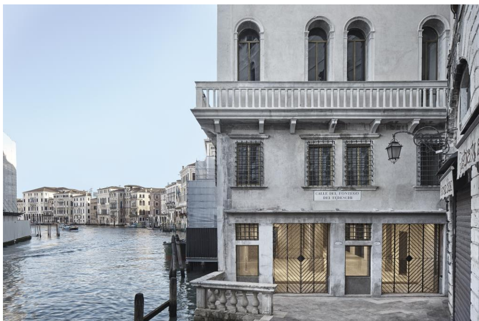
Die äußere Gebäudehülle wurde sehr gelungen und detailgerecht restauriert.