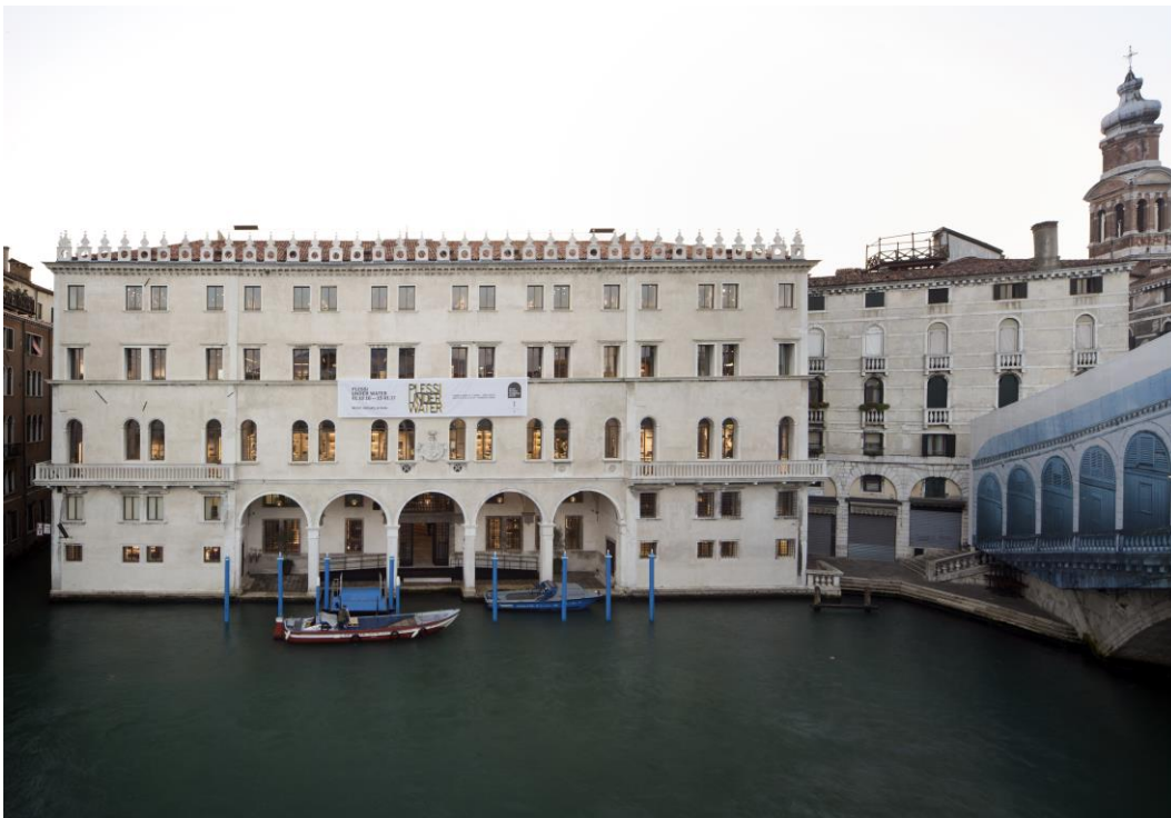
Das restaurierte „Fondaco dei Tedeschi“, rechts daneben die Rialto-Brücke.