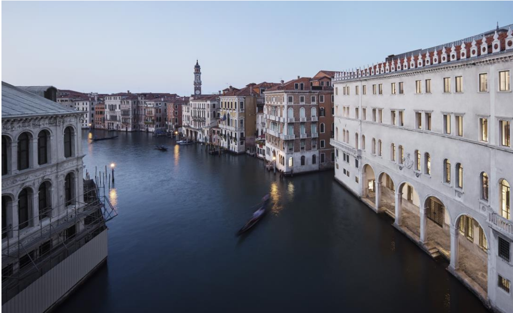
Blick auf das restaurierte „Fondaco dei Tedeschi“ (rechts) von der Rialto-Brücke aus.