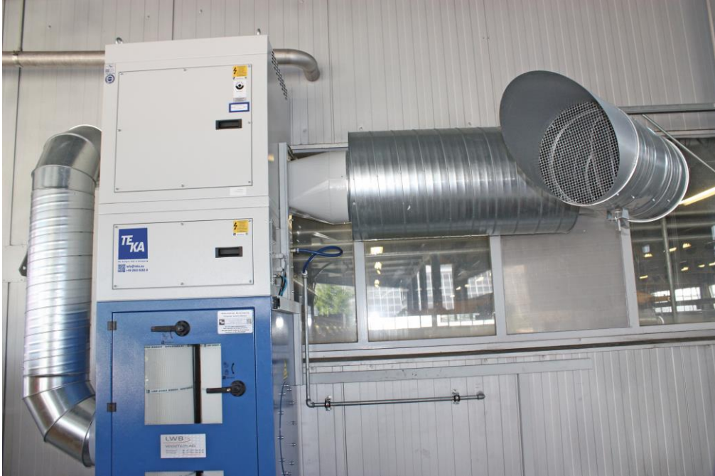
Auch zur Außenaufstellung ist die Absaug- und Filteranlage Filtercube geeignet.