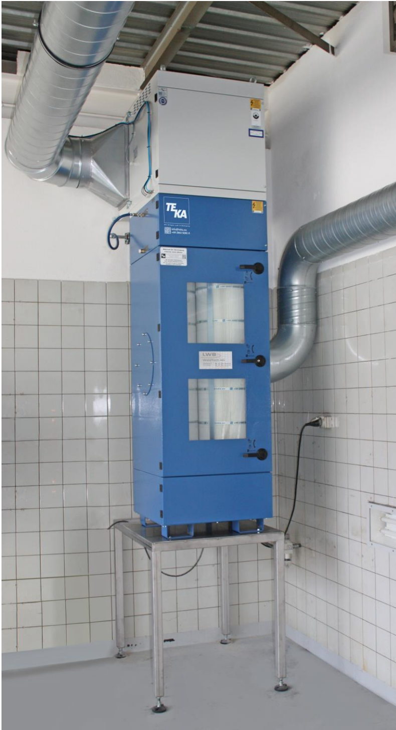
Die kompakte Absaug- und Filteranlage Filtercube ist platzsparend in einem Nebenraum untergebracht.