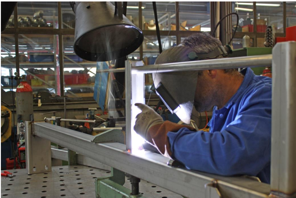
Schweißer sind optimal geschützt, da Absaugarme den Rauch direkt an der Entstehungsstelle aufnehmen.