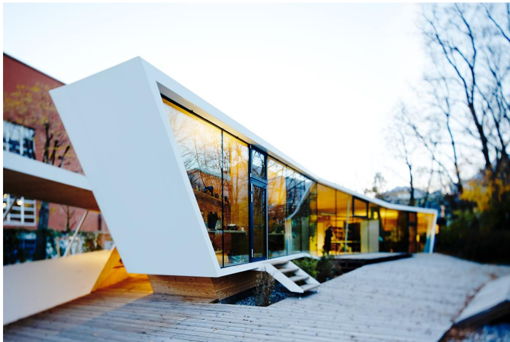
An dieser Glasfront sind drei verschiedene Sonnenschutzgläser verbaut worden, die aber optisch angepasst sind und dadurch keine Farbunterschiede zeigen.