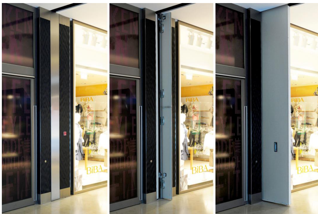
Brandschutz in einer Mall: Das Feuerschutz-Schiebetor steht im Normalbetrieb eingefahren in einer Gebäudenische. Eine attraktive Edelstahlklappe verdeckt das Tor. Im Brandfall öffnet sie sich automatisch und das Tor fährt zu.