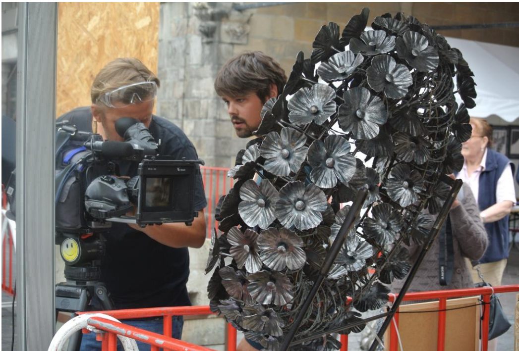
Gedenkkranz für die englische Gedenkstätte Menentor.