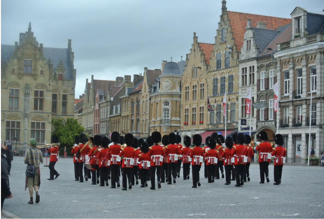
Die Abordnung der Königin von England.