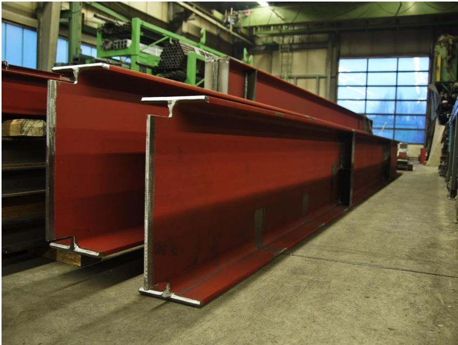
IPE 600 für den Rahmen der Podeste.