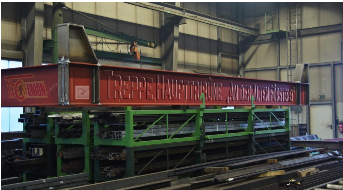
Ein Podest ist fertig.