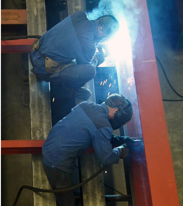
Die Podeste nehmen in der Werkstatt Gestalt an.