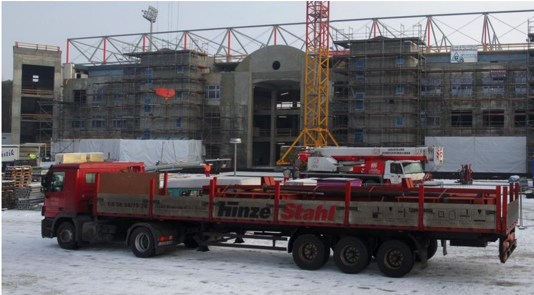
Die Anlieferung der Treppeneinzelteile.