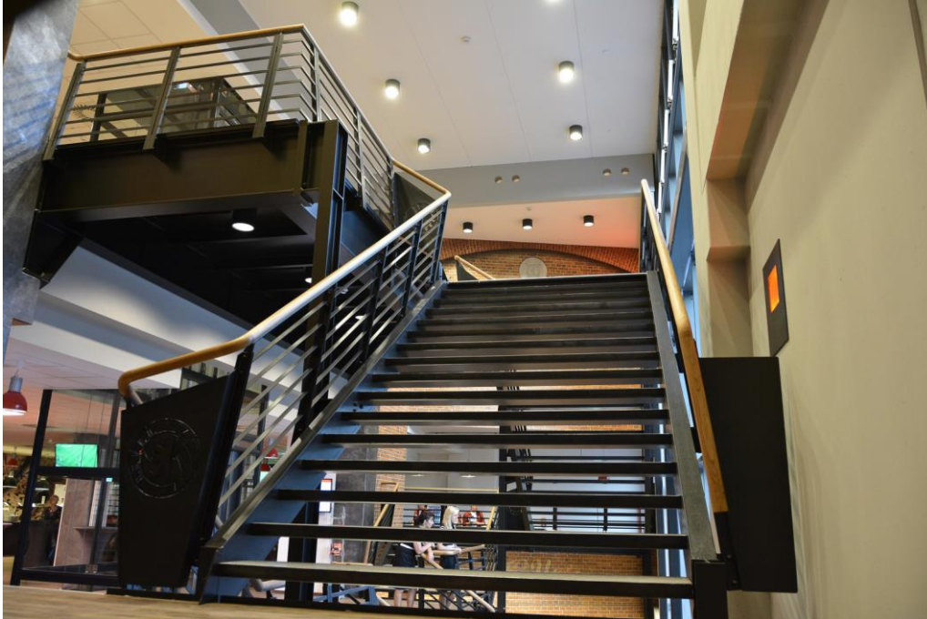
Die Industriearchitektur des vorigen Jahrhunderts ist deutlich erkennbar.