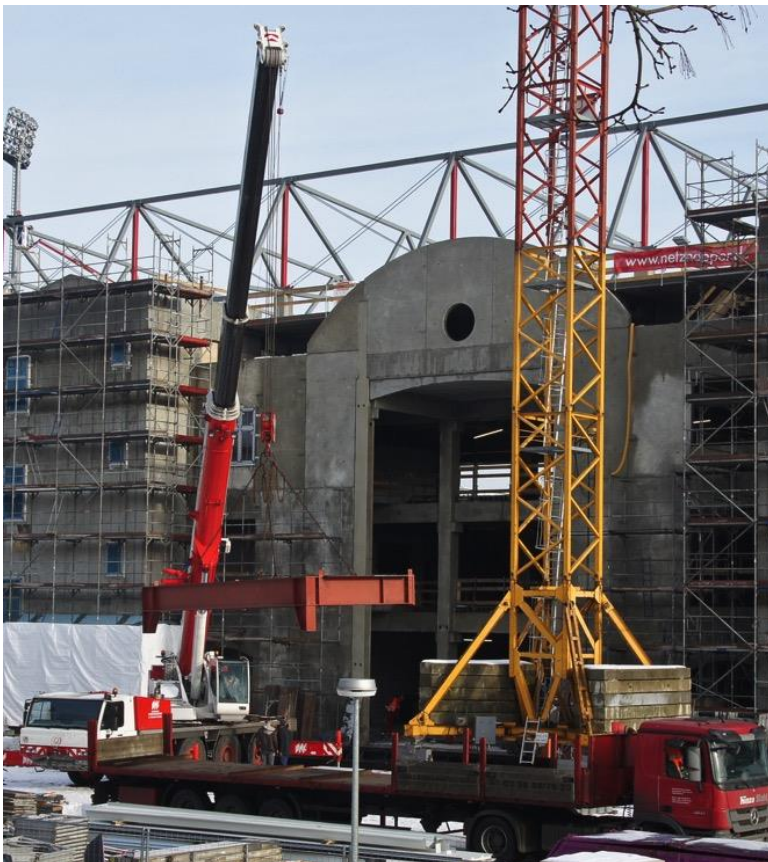
Die Bauteile werden „eingefädelt“.