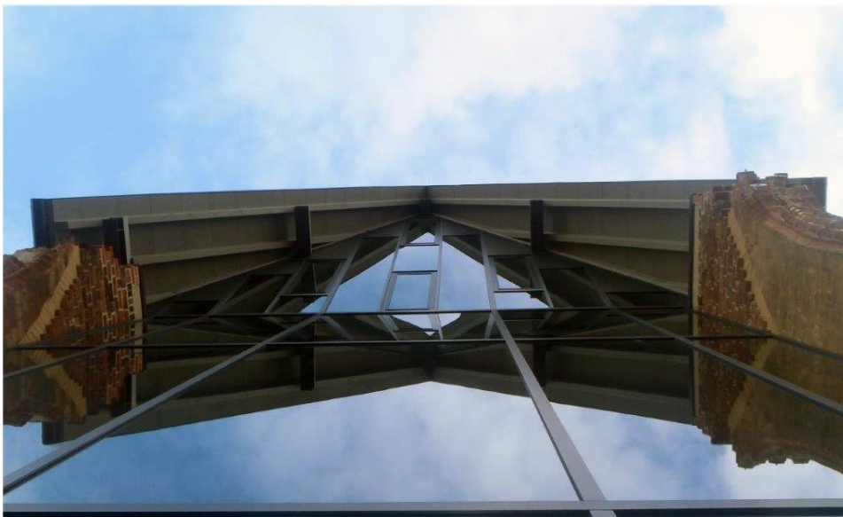
Kompliziert waren die Wandanschlüsse und die doppelte Fassadenneigung.