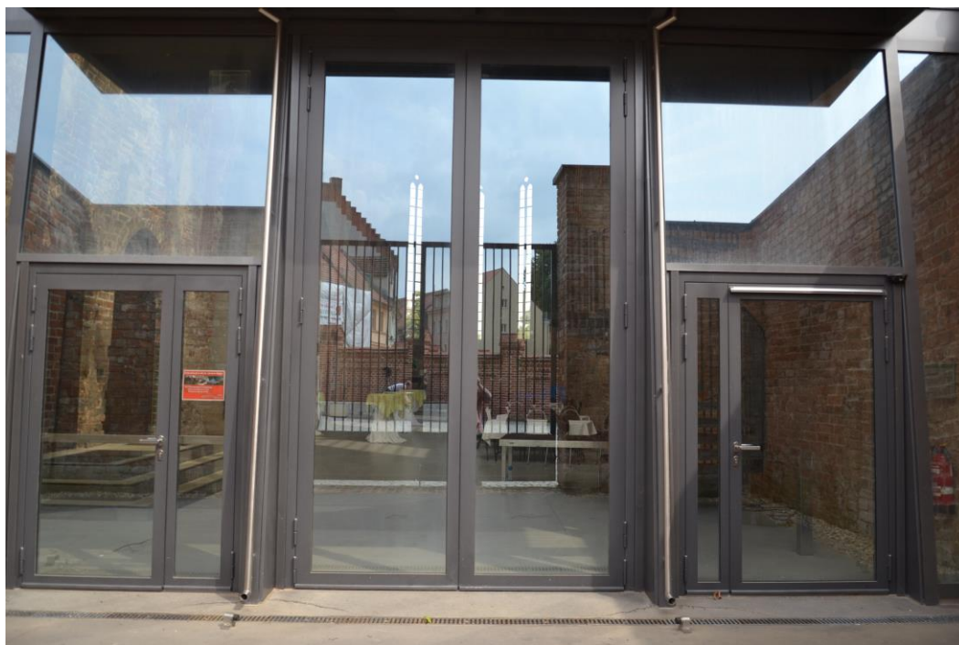
Zum Arbeitsumfang gehören auch Türen.