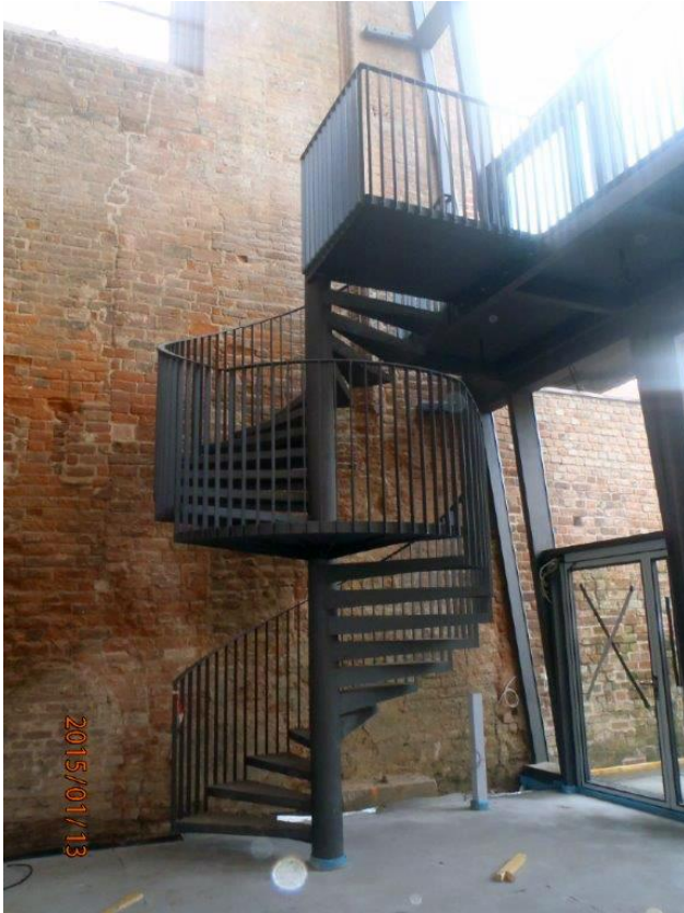
Zu den Metallbauerleistungen gehören auch ein Podest und die Wendeltreppe.