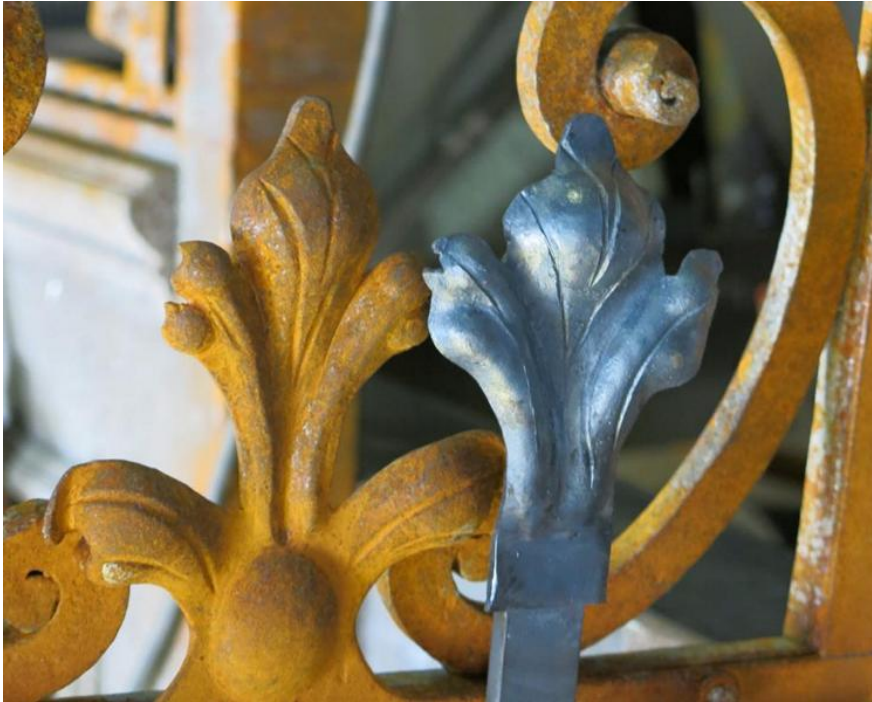
Nur eine Zierranke musste neu geschmiedet werden.