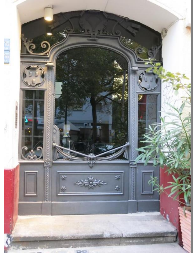
Die 117 Jahre alte Gründerzeit-Hauseingangstür für ein Wohnhaus in Berlin-Charlottenburg: Vor der Restaurierung nach der Restaurierung.