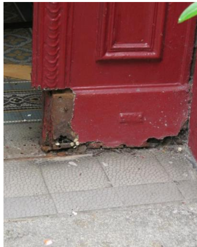
Die Macht des Urins! Die Korrosionsschäden im unteren Bereich waren kräftig.