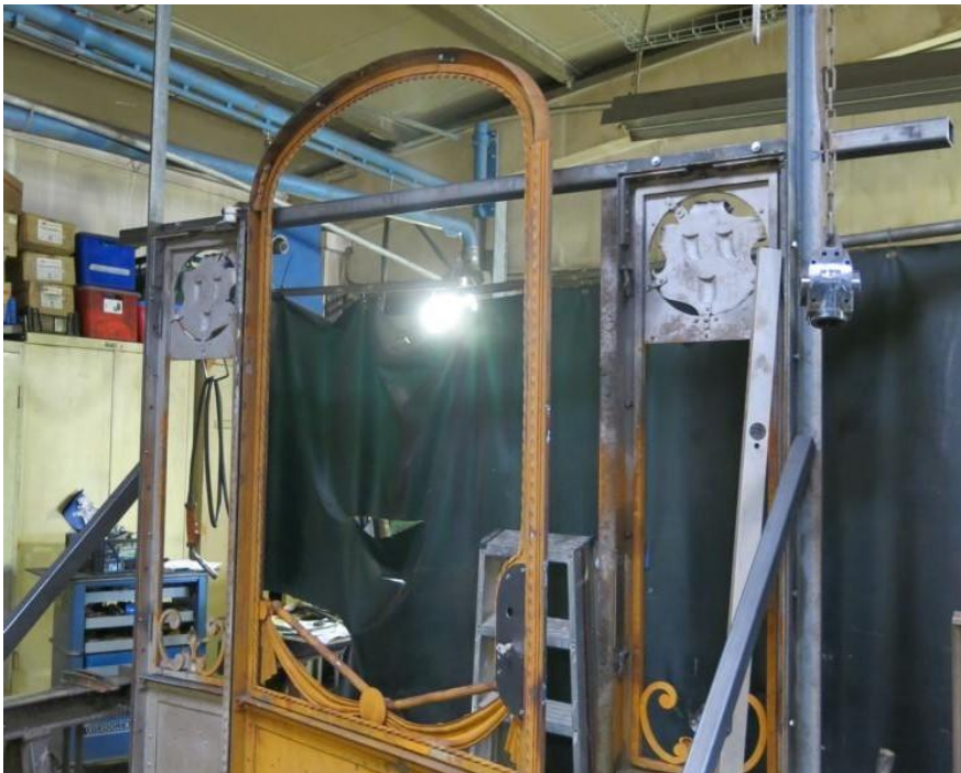
Die Arbeit wurde mit viel Einfühlungsvermögen für das Material, für die historischen Zusammenhänge und für die Wünsche der Bauherren ausgeführt.