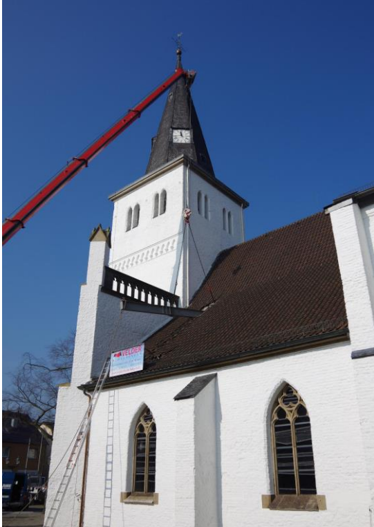
Der Stahlträger wurde über das Dach eingefädelt.