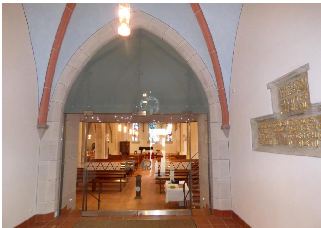
Der Eingangsbereich wurde durch eine transparente und filigrane Stahl-Glas-Konstruktion abgetrennt.