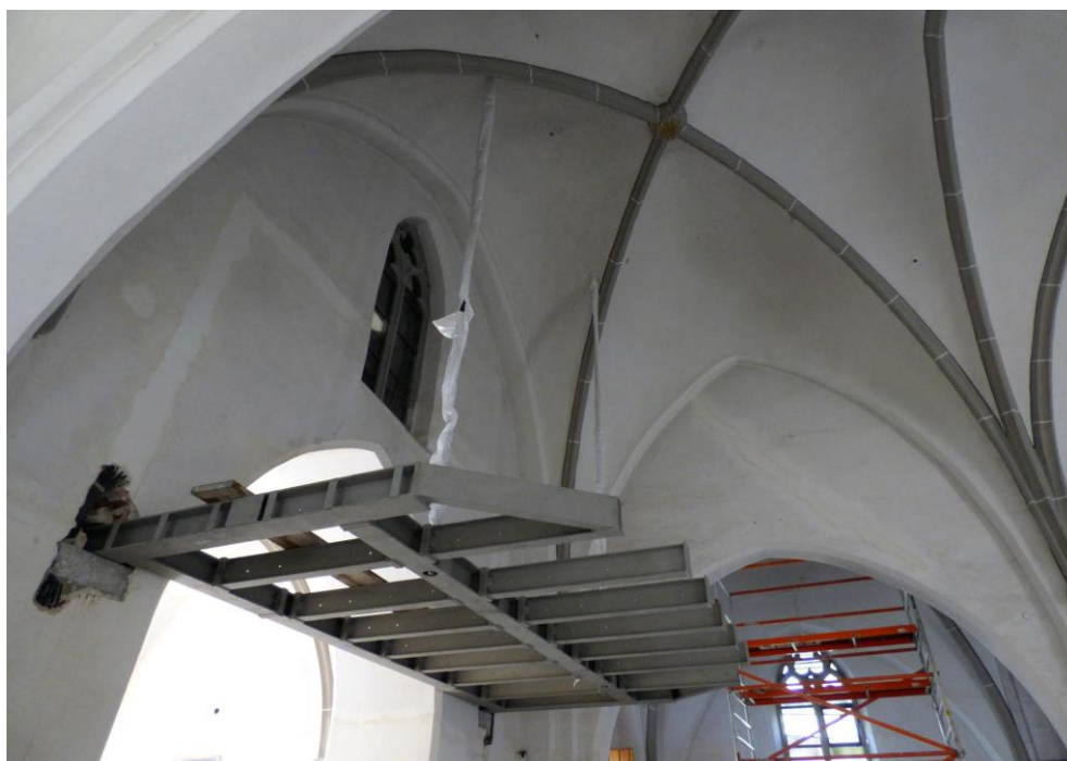
Die Grundkonstruktion des Orgelpodestes wurde in der Wand verankert und an dem Stahlträger unter dem Dach aufgehängt.