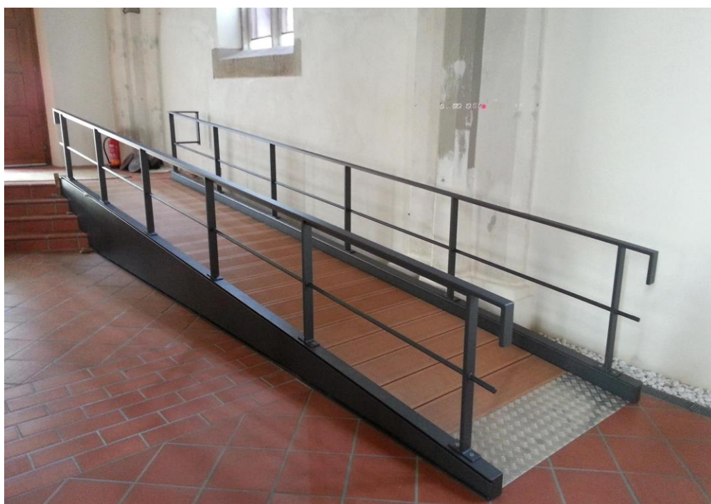
Zu den Metallbau-Leistungen gehörte auch eine Rollstuhlrampe.