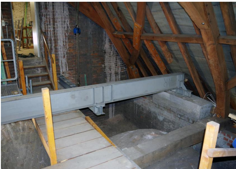
Der Stahlträger dient als Halterung für die gesamte Konstruktion des Orgelpodestes.