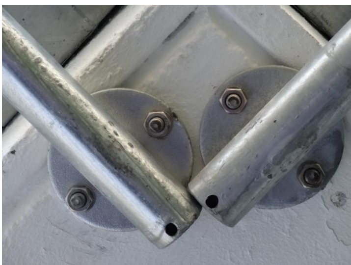
Typische Fehler an der Befestigung: Zu kleine Ankerplatten und zu geringe Achs- und Randabstände der Verankerungen.