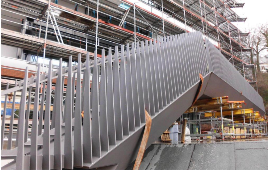
Die Brücke befindet sich am Vormontageplatz.