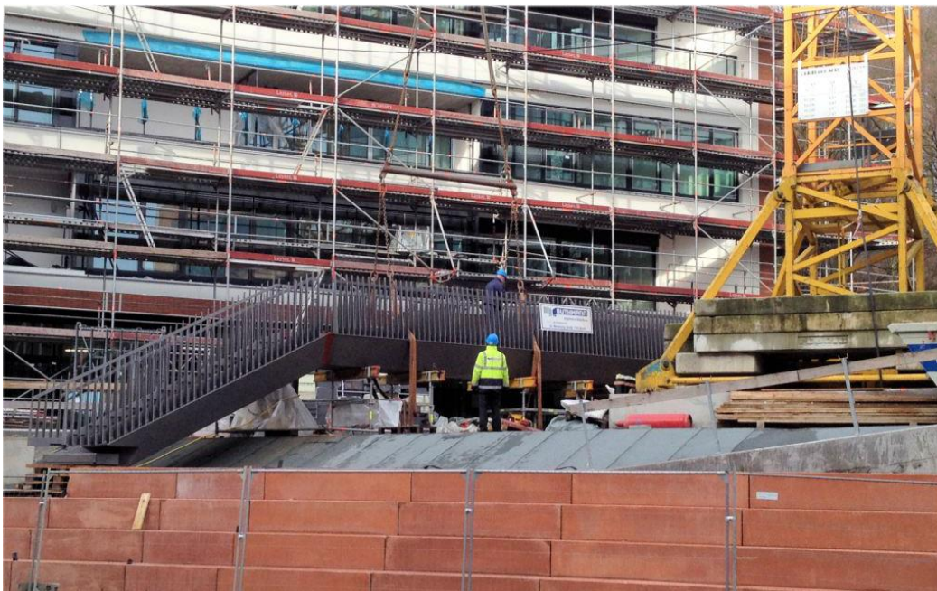
Langes Brückenteil mit Treppenteil an beengtem Vormontagplatz.