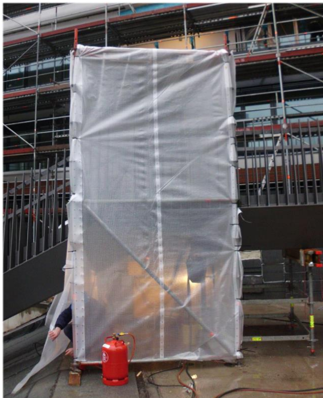
Örtliches Schweißen und Temperatur- und Wetterschutz.