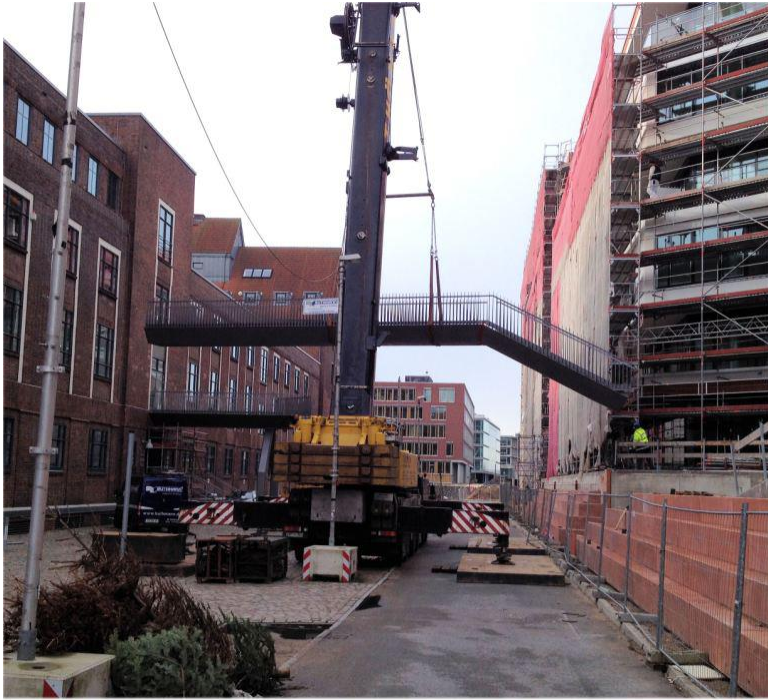
Hub und Einschwenken des langen Brückenteils.