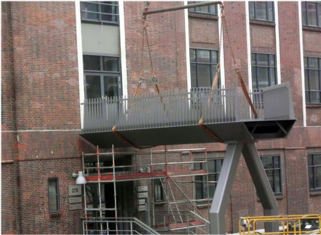
Einhub des breiten Brückenteils.