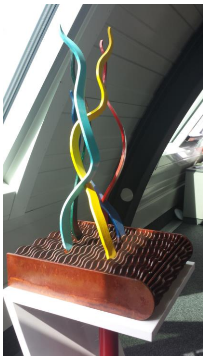
Besonderes Interesse fand die „Vorab-Vernissage“ der aktuellen Ausstellung der Landesfachgruppe Gestaltung mit dem Titel „Kontraste“.