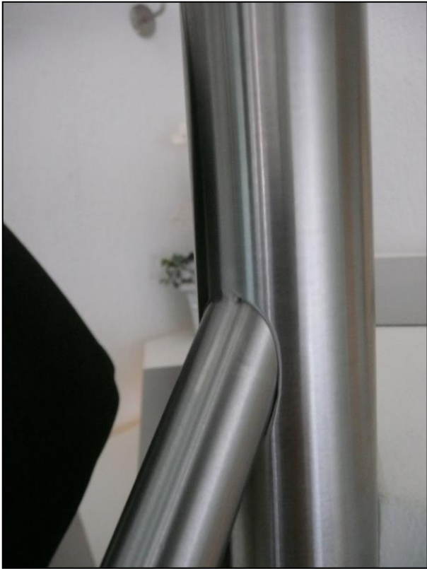
Die Füllstäbe sind mit einer Heftnaht fixiert.