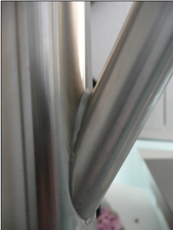
Die Verbindung zwischen Füllstab und Pfosten mit teilweise umschweißter Kehlnaht.