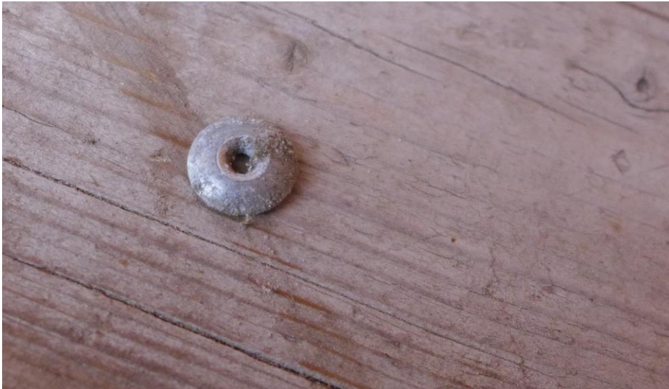
Beim Ortstermin wurden noch abgerissene Niete gefunden.